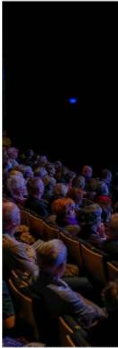
L'édition 2022 a accueilli environ 1500 spectateurs.