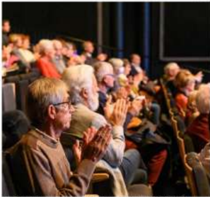
Les Entretiens permettent à la population, mais aussi aux agents de la municipalité, de s'interroger sur le sens de ce qu'ils réalisent au quotidien.