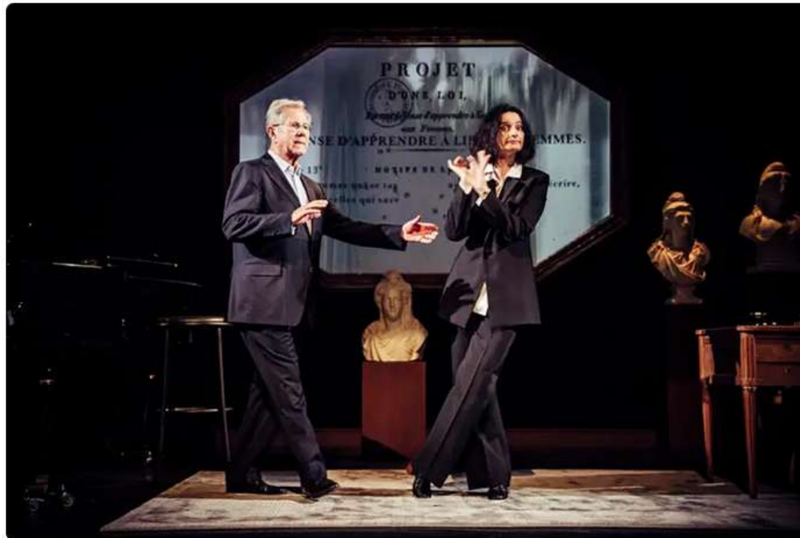
Ces femmes qui ont réveillé la France

À ne pas rater, l'exposition Regards pour l'histoire , autour de captations vidéo, de dessins de presse et de BD, consacrée au procès de Klaus Barbie.