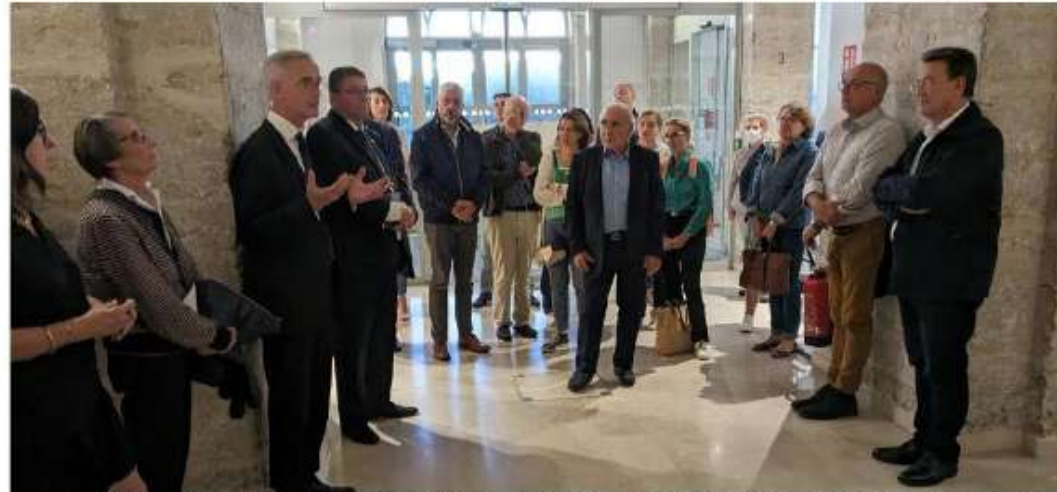
Lors du vernissage, élus et organisateurs ont rappelé que cette exposition est itinérante, afin de toucher le plus large public.

L'exposition montre notamment des planches dessinées : « C'est une façon très accessible de présenter ces dossiers graves, en particulier auprès des jeunes publics. La bande dessinée de Jean-Claude Bauer a été traduite et vendue en Bolivie et en Allemagne, ce qui témoigne d'une conscience historique globale sur ces questions. » Une dizaine d'élèves de termi-