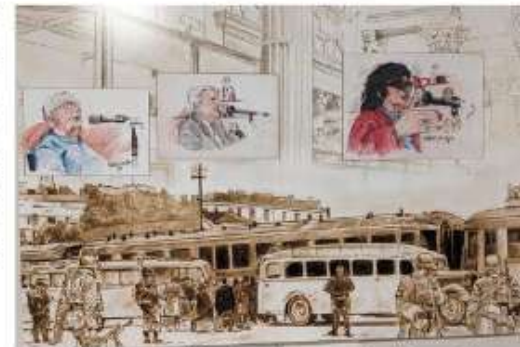
Ces dessins sont visibles jusqu'au 14 octobre à la mairie. Dessins Jean-Claude Bauer

Jusqu'au 14 octobre, atrium de l'hôtel de ville. Aux heures d'ouverture de la mairie.