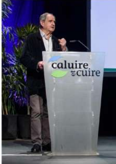
Les Entretiens de Caluire et Cuire Jean-Moulin invitent à une réflexion sur la démocratie, avec des invités renommés – comme le sociologue Pierre Rosanvallon (à droite).

➔ Écrivez libre sur inscription, radiant-bellevue.fr, informations sur entretiens.ville-caluire.fr