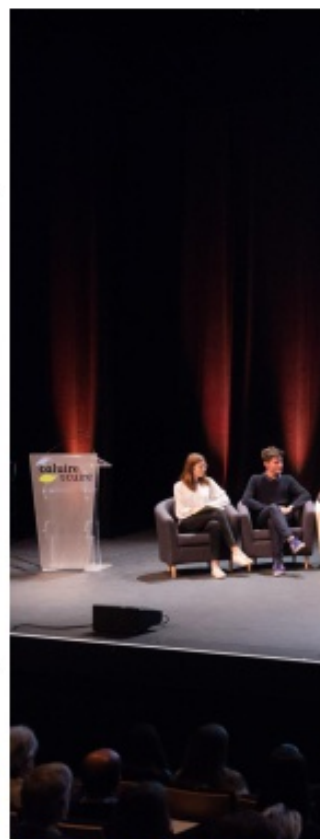
Conférences, tables rondes, débats et proje

» Entrée libre sur inscriptions http://entretiens.ville-caluire.fr