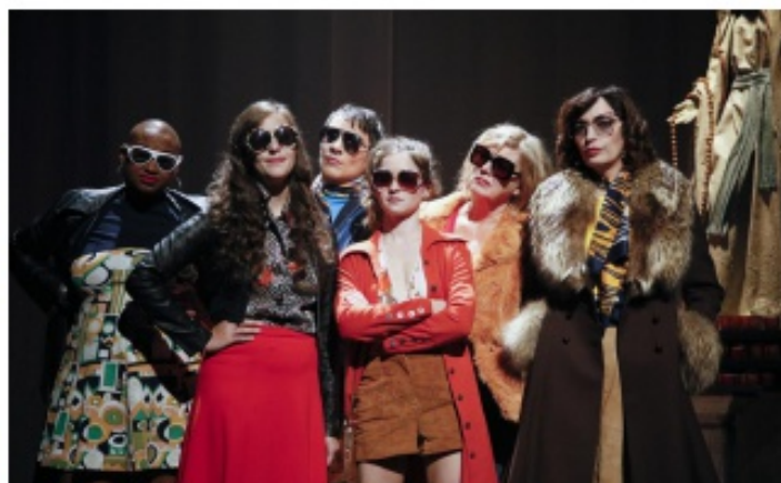
Loveless fait écho au thème de la citoyenneté de cette 4 e édition des Entretiens.

Les questions soulevées par la pièce de théâtre sont nombreuses. Quelle place le sexe occupe-t-il dans notre société? Pourquoi le sexe ne peut-il pas être moralement un commerce acceptable? La situation des prostituées, le regard porté sur elles ont-ils changé depuis 1975?... Des questions qui susciteront sans doute le débat. Un