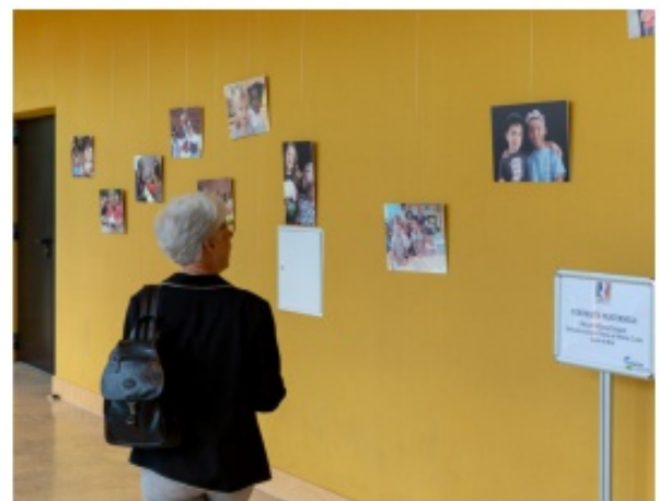
De nombreuses animations, comme des expositions, auront lieu en marge des Entretiens.