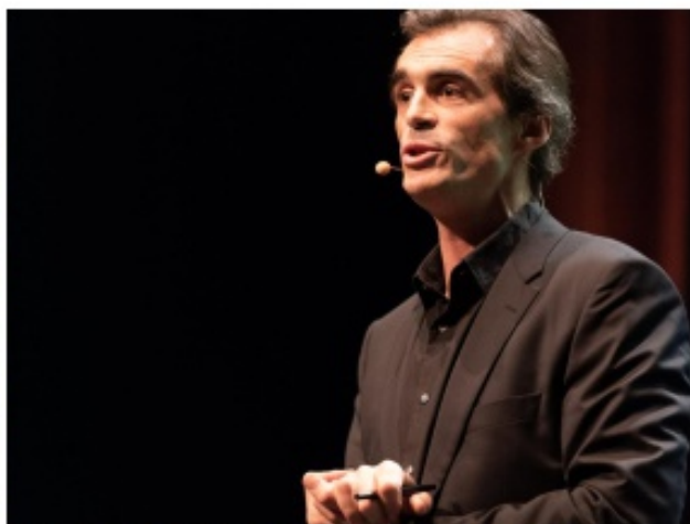
L'an dernier, Raphaël Enthoven, philosophe et essayiste, faisait partie des intervenants.