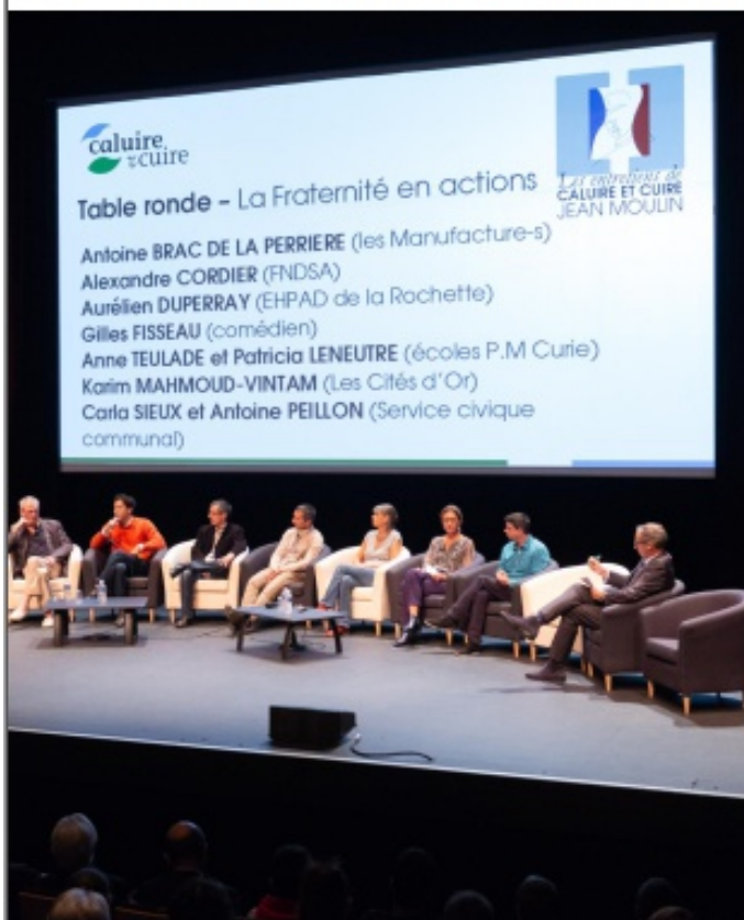
actions animeront les Entretiens de Caluire et Cuire - Jean-Moulin