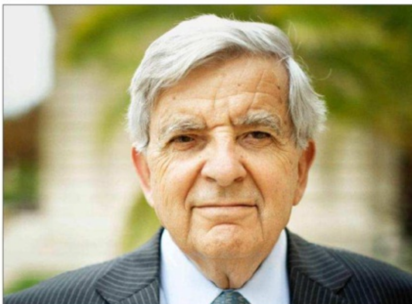
Jean-Pierre Chevènement, ancien ministre.

Nous allons aborder la question de la déconstruction de l'idée de citoyenneté à partir de société des individus, une société où il y a des droits, mais où il n'y a plus de devoirs. Je montrerai ce à quoi pourrait ressembler une reconstruction de la société et nous parlerons de l'Europe, des médias, des réseaux sociaux, du débat public et de la manière dont on peut retrouver une démocratie qui s'abreuve aux sources des Lumières. Car la citoyenneté est indissociable de la Révolution française, indissociable de Rousseau et du siècle des Lumières. »