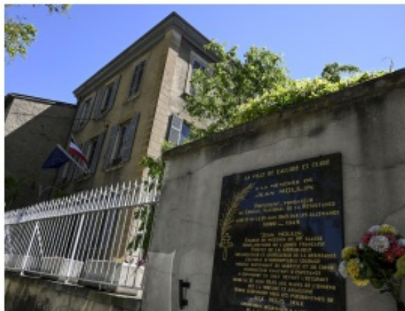
SAMEDI 28 SEPTEMBRE 2019

Les Entretiens de Caluire et Cuire rendent hommage à la figure et au parcours du héros de la Résistance