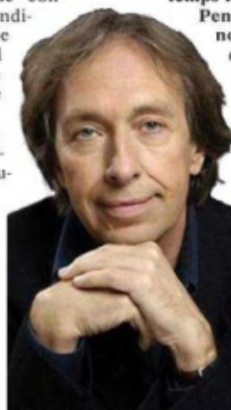
Pascal Bruckner, philosophe et écrivain.

« Toutes les époques sont incertaines. Tous les hommes ont abordé l'avenir dans une sorte de clair-obscur ou de ténèbres. Aujourd'hui, on a du mal à comprendre le monde dans lequel on vit. Mais ce n'est pas une raison pour désespérer de l'avenir. »