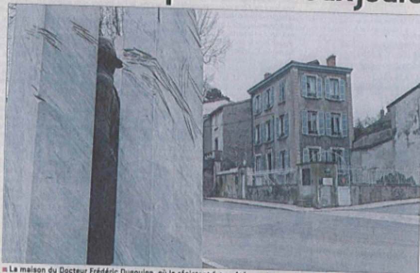
■ La maison du Docteur Frédéric Dugoujon, où le résistant fut arrêté, est devenue le "Mémorial Jean Moulin". Caluire demeure ainsi un lieu de mémoire en lien avec l'histoire de la Seconde guerre mondiale.

Les valeurs de la République, était le thème choisi pour les premiers "Entretiens", organisés sur deux jours fin mai 2016. Cette manifestation avait été inspirée à la Ville par la dure réalité qui avait touché la France, traumatisée par les attentats du Bataclan et de Charlie Hebdo . Ces tragédies n'avaient cessé de susciter les débats dans le pays, en particulier sur les valeurs de la République. Caluire, qui reste un lieu de mémoire en lien avec l'histoire de la Seconde guerre mondiale, avait alors décidé de s'inscrire dans cette réflexion, en proposant deux journées de débats avec des intervenants de qualité. Avec toujours la même ambition de croiser les regards, la municipalité a choisi cette an-