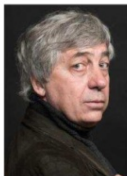
■ Sorj Chalandon.