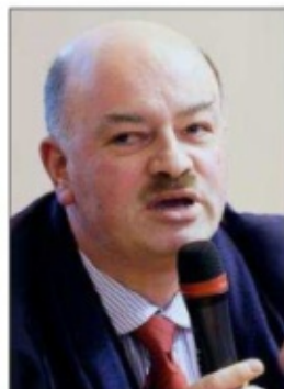
■ Alain Bauer.