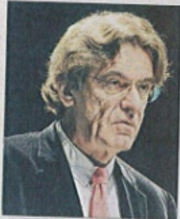
■ Luc Ferry, philosophe et ancien ministre.