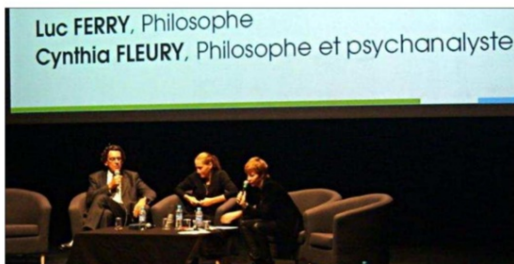
■ Luc Ferry a été la tête d'affiche des 33 intervenants qui ont participé à cette 2 e édition.

Aux côtés de Cynthia Fleury, philosophe et psychanalyste, Luc Ferry a conclu un peu plus tard les entretiens, en débattant des mutations socio-économiques à venir. De la place de l'intelligence artificielle en plein développement, au