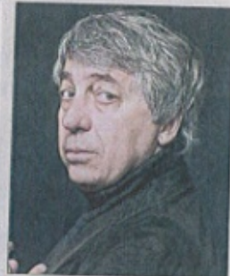
■ Sorj Chalandon, journaliste et écrivain.